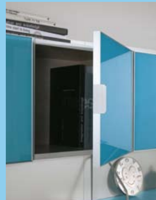
Particolare di anta vasistas e anta battente con telaio alluminio e vetro laccato.