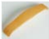
JOKER - ARANCIO