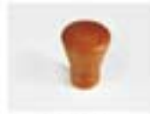
CUP - CILEGIO