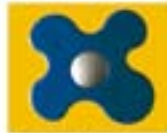
FAFFALLE - BLU