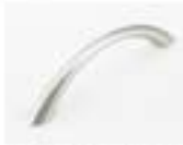
ARCO - ALLUMINIO