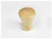
CUP - PERO