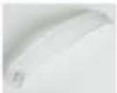
JOKER - BIANCO