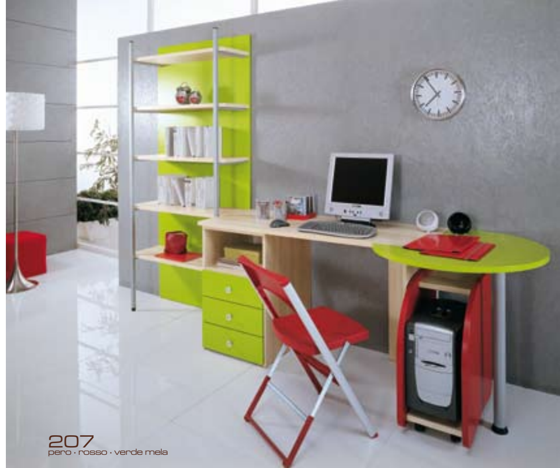
207 pero · rosso · verde mela

SICUREZZA: top con angoli arrotondati rifiniti con bordo spessore.