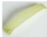
JOKER - VERDE