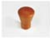
CUP - NOCE