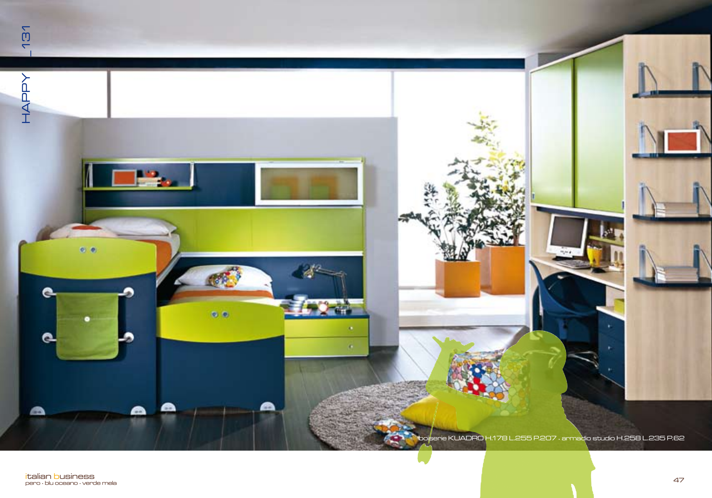
boiserie KUADRO H.178 L.255 P.207 · armadio studio H.258 L.235 P.62