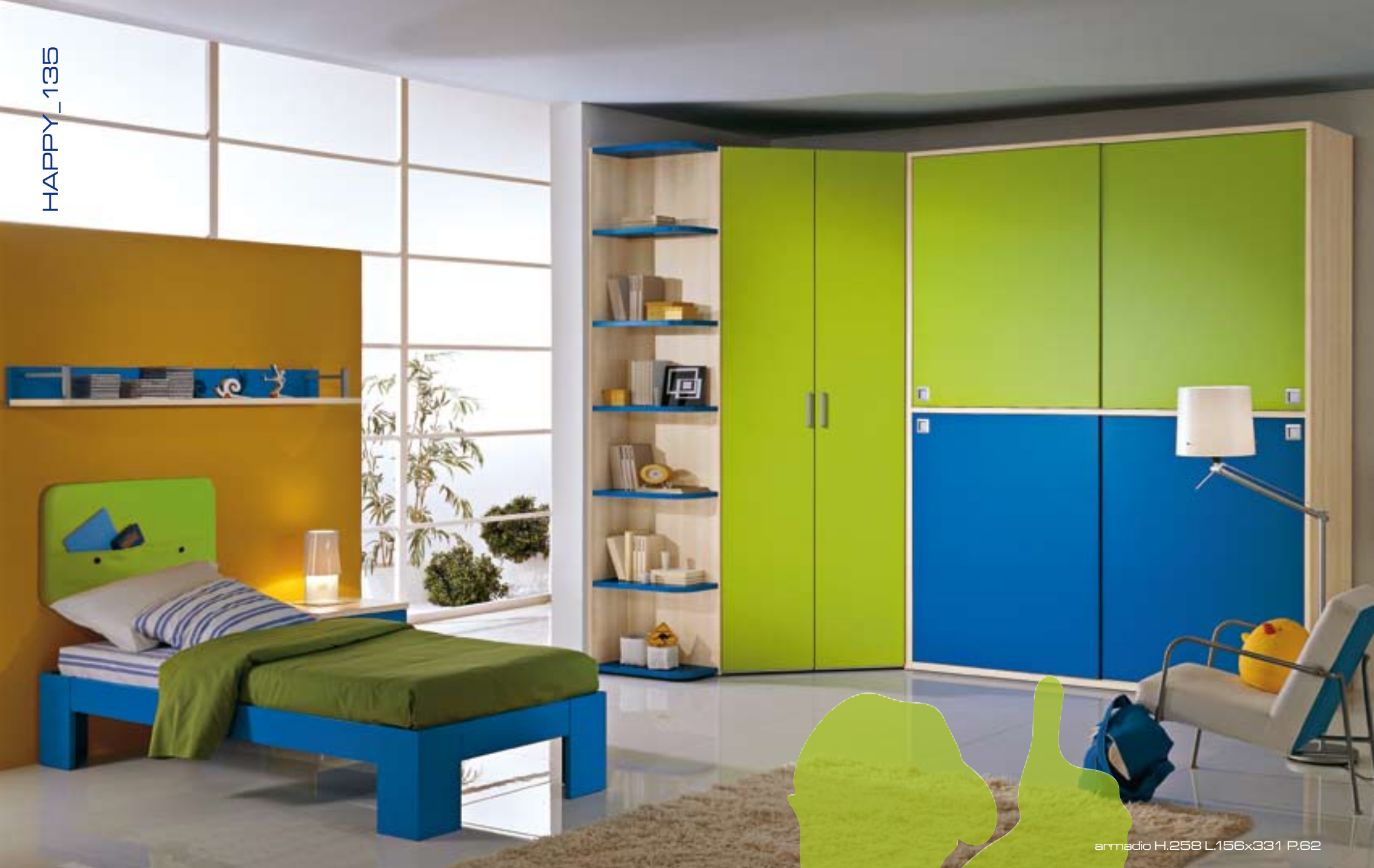
armadio H.258 L.156x331 P.62