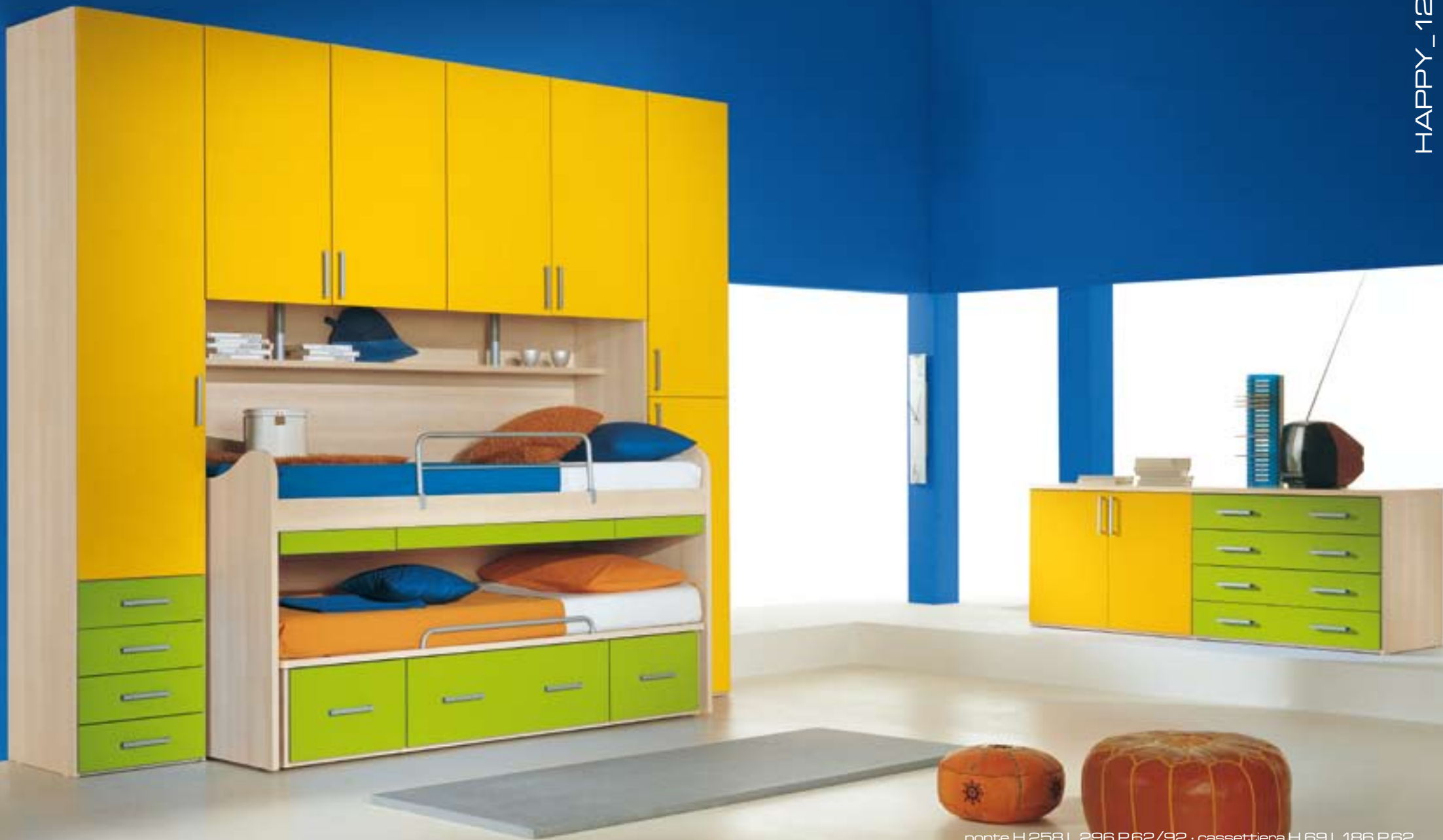
ponte H.258 L.296 P.62/92 · cassettera H.69 L.186 P.62