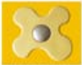
FAFFALLE - GIALLO