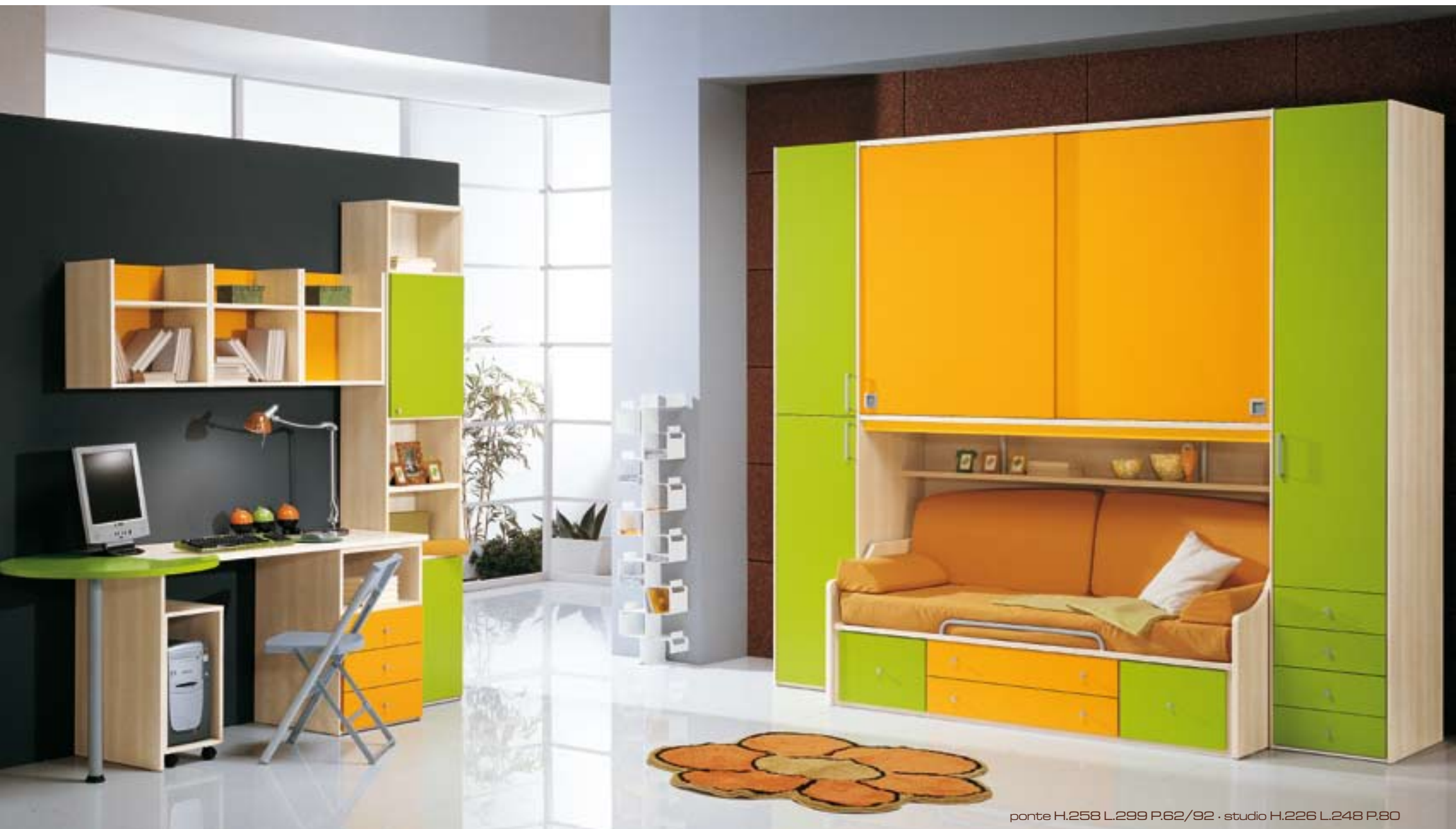
ponte H.258 L.299 P.62/92 · studio H.226 L.248 P.80