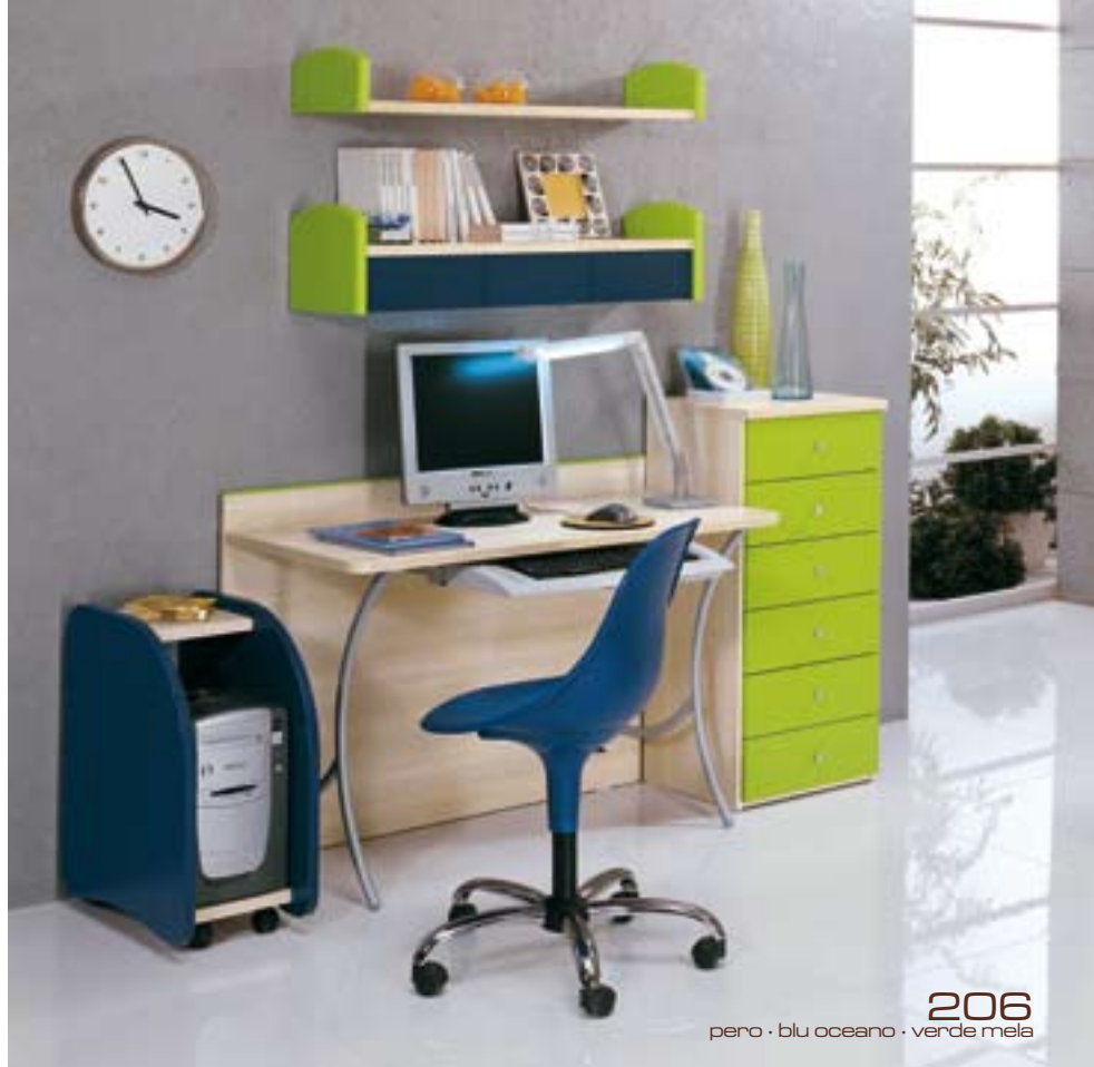
206 pero · blu oceano · verde mela