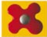
FAFFALLE - ROSSO