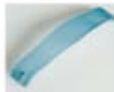
JOKER - BLU