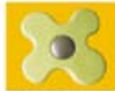
FAFFALLE - VERDE