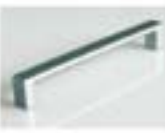
SUN - ALLUMINIO