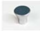
BOTTO - ALLUMINIO