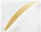
ROUND - PERO