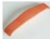
JOKER - ROSSO