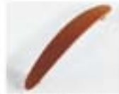
ROUND - CILEGIO