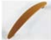
ROUND - NOCE